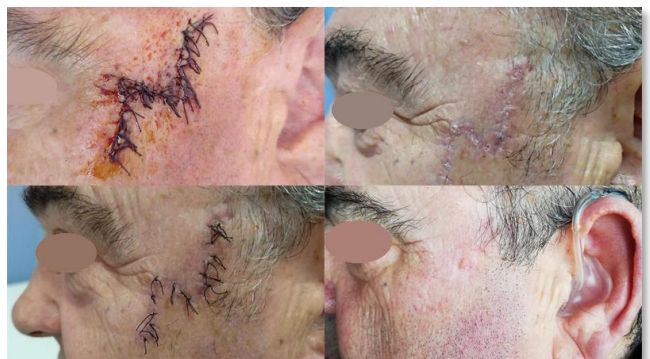
Figura 3. Evolución

Conclusiones: El caso pone en relevancia la importancia del médico de familia y la atención primaria en el diagnóstico precoz y el tratamiento del CBC gracias al empleo de la dermatoscopia y de técnicas avanzadas en cirugía menor como la Z-plastia.