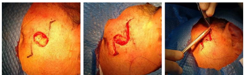
Figura 2. Proceso de excisión y Z-plastia